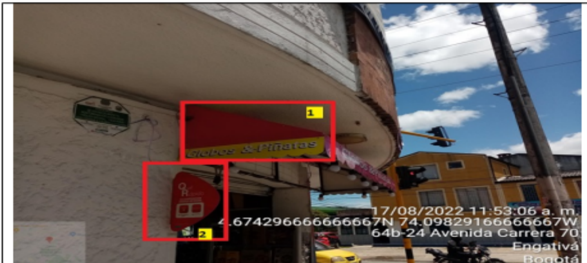
En la cual se evidencian dos (2) elementos no regulados pertenecientes al establecimiento comercial denominado PIÑATERÍA GLOBOS Y PIÑATAS , los cuales se encuentran volados de la fachada del establecimiento comercial.