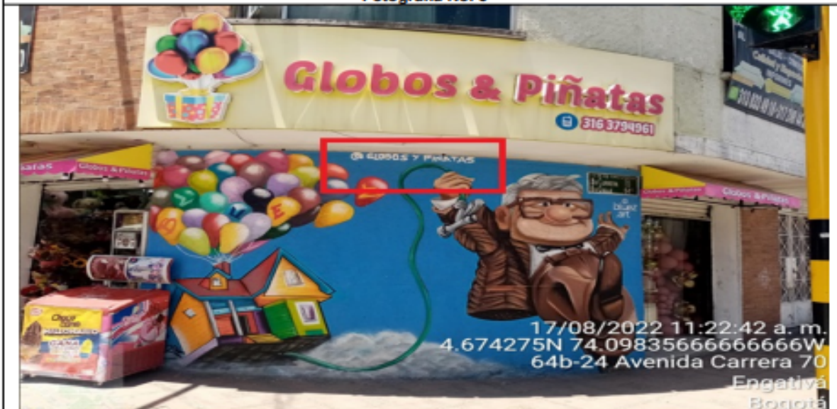
En la cual se evidencia un (1) elemento PEV perteneciente al establecimiento comercial denominado PIÑATERÍA GLOBOS Y PIÑATAS , el cual es adicional al único elemento permitido por fachada de establecimiento.